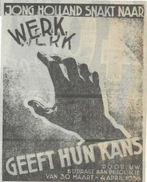
Advertentie in "De Spiegel", d.d. 14 maart 1936. "De straten zijn bevolkt met jeugdige werklozen. Doelloos gaan ze hun weg. Geen plaats op de arbeidsmarkt... uitgestoten! Vierduizend jonge mensen van christelijken huize, tusschen 17-25 jaar, die werken willen, kunnen geholpen worden en in 1936 acht weken arbeiden, lichamelijk en geestelijk worden gesterkt. Draagt gij Uw deel bij?"